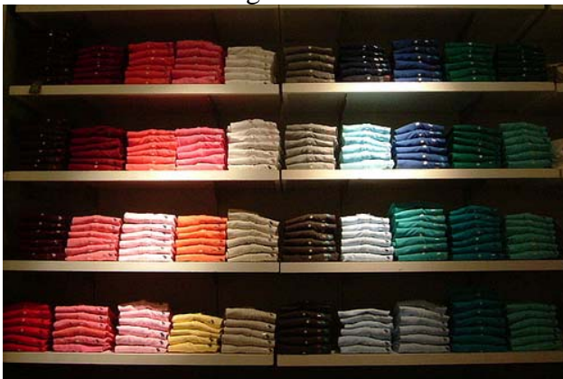
Un étalage de chandails