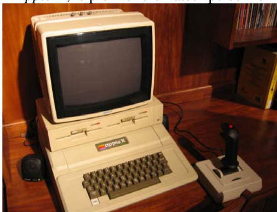
Apple II, le premier ordinateur personnel